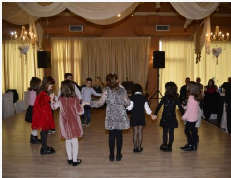
View the full image [9]