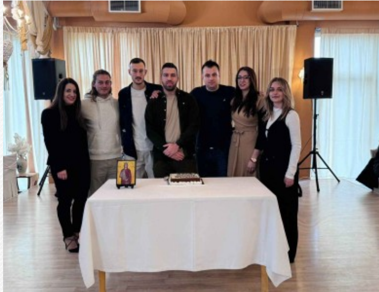
View the full image [7]