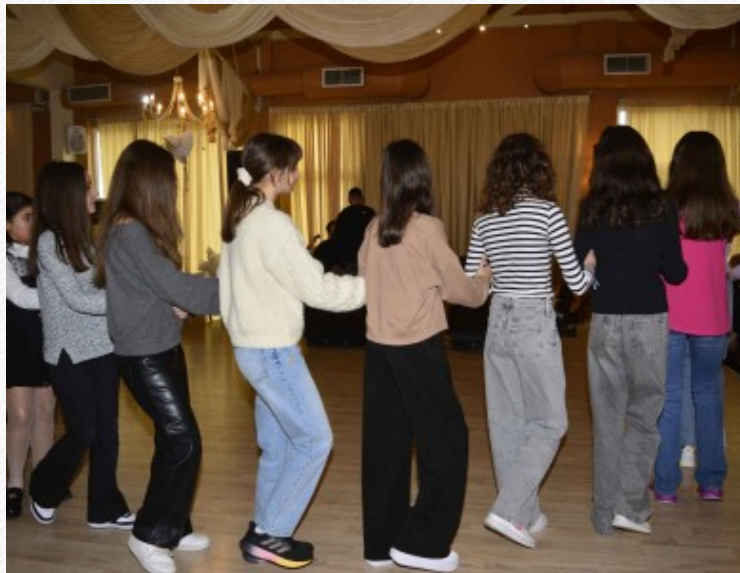
View the full image [8]